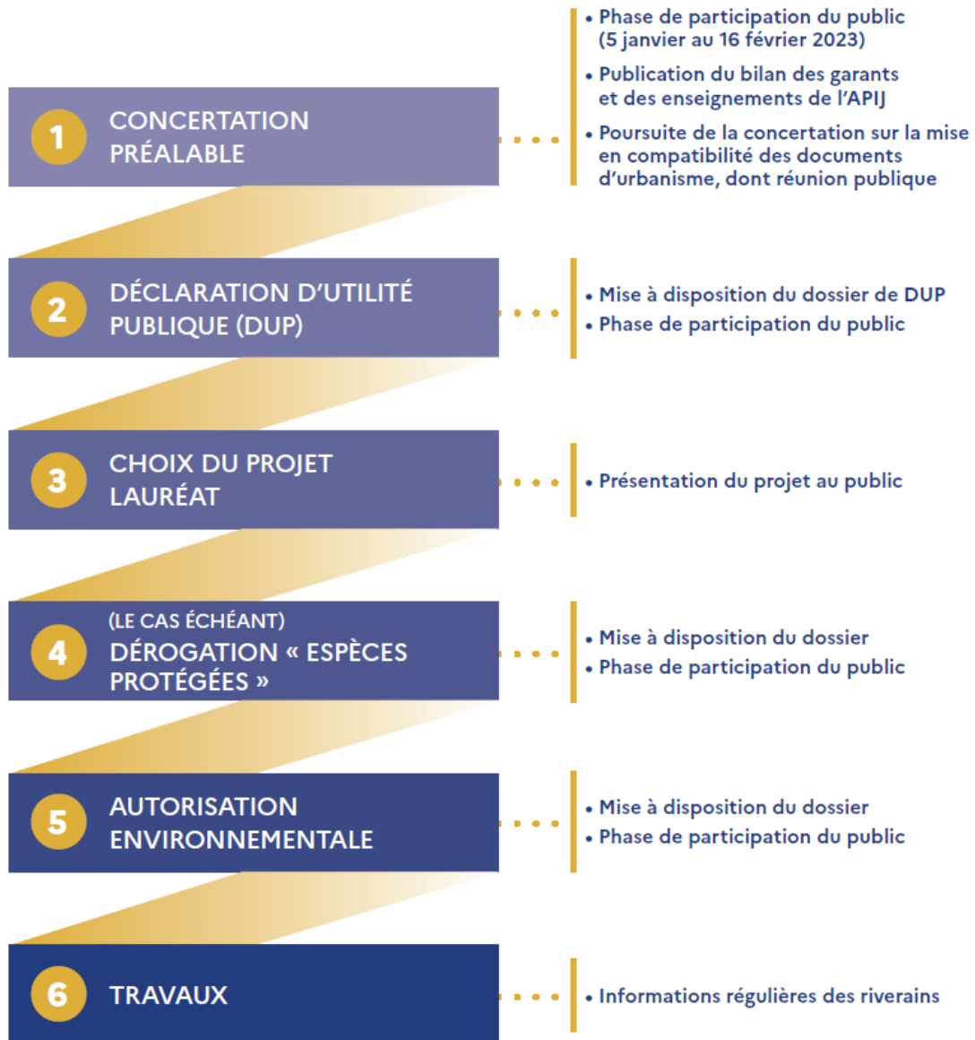
Schéma des suites de la procédure et de l'association du public :